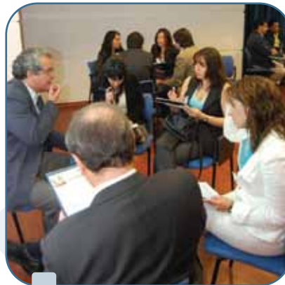
Participantes en taller de desarrollo e intercambio RSE.